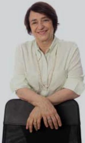
1ª Secretária Rosana Lazzarini | SP